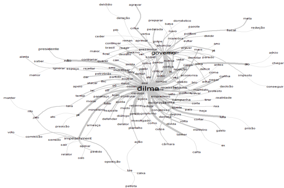
Gráfico 2: Similitudes em O Globo