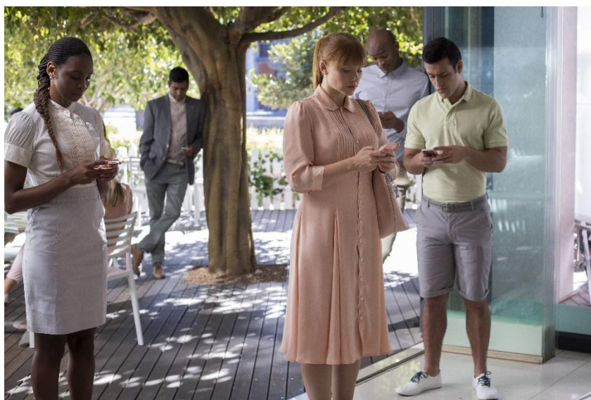
Figura 2 – Cena do episódio “Nosedive”

um assento em um voo lotado, bem como em sua inclusão como dama de honra no casamento de uma amiga de infância, tola, rica - e muito bem avaliada. A fim de conquistar pontos em sua avaliação, Lacie termina por consultar um especialista, uma espécie de expert e coach , que analisa por meio de gráficos suas relações sociais e aconselha ações e modos de ser para dar um “ boost ” (impulso) no ranqueamento da personagem. Em inglês, a empresa a que recorre se chama Reputelligent . Conforme fica evidenciado, práticas e lógicas do modelo empresarial de vida foram integralmente incorporadas nessa sociedade “futura”.