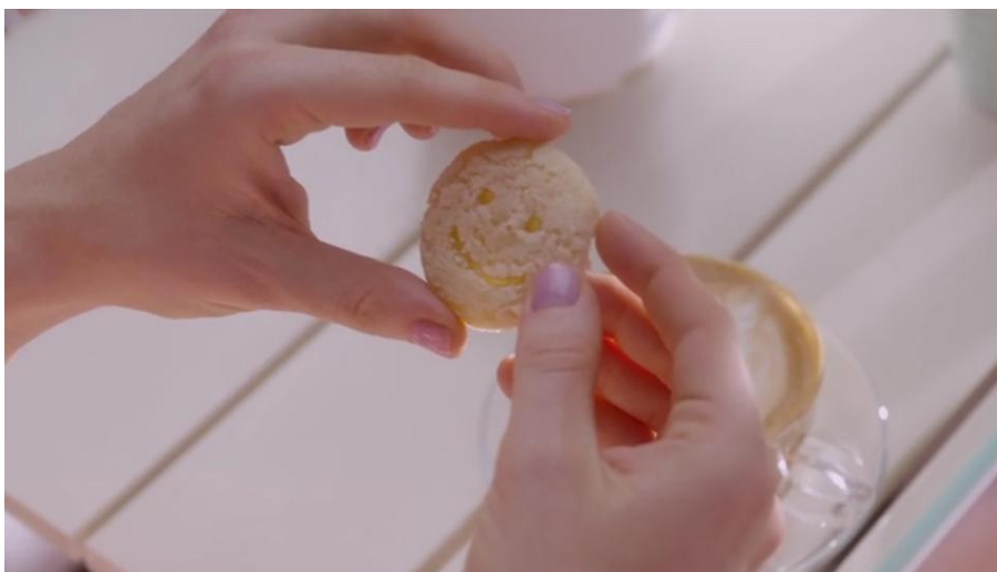
Figura 4 – Ícone Smiles a ser literalmente ingerido em “Nosedive”

No episódio “Queda livre”, o que se “avalia” mal? Sobretudo a emergência ou a explosão inadvertida de afetos espontâneos e agressivos, como sentimentos de raiva, incômodo, desassossego (e reivindicações). Nada mais compatível com uma cultura na qual o sorriso compulsório do ícone Smiles expressa com propriedade a ditadura da imagem da felicidade espetacularizada na superfície dos rostos e a pressão pelo sucesso individual. Essa imagem de aquiescência total, indicativa de sucesso e “autoestima”, remetida ao pequeno grupo de “vencedores” (FREIRE FILHO, 2010), torna literalmente obscenos sofrimentos, agruras, fracassos e tensões sociais. A imagem do ícone Smiles aparece explicitamente em um momento do episódio “Queda livre”: Lacie toma um café, acompanhado de um biscoito com a tal carinha sorridente, que ela fotografa certamente para compartilhar. Antes disso, treina sorrisos gentis em frente ao espelho de casa. A figura Smiles – igualmente implicada no autoritário e cínico “sorria, você está sendo filmado” – pode ser associada à violência predatória do sorriso-esgar Mickey revelado, pelo menos desde o início do século XXI, em filmes como Mulholland Drive (Cidade dos Sonhos, 2001), de David Lynch.