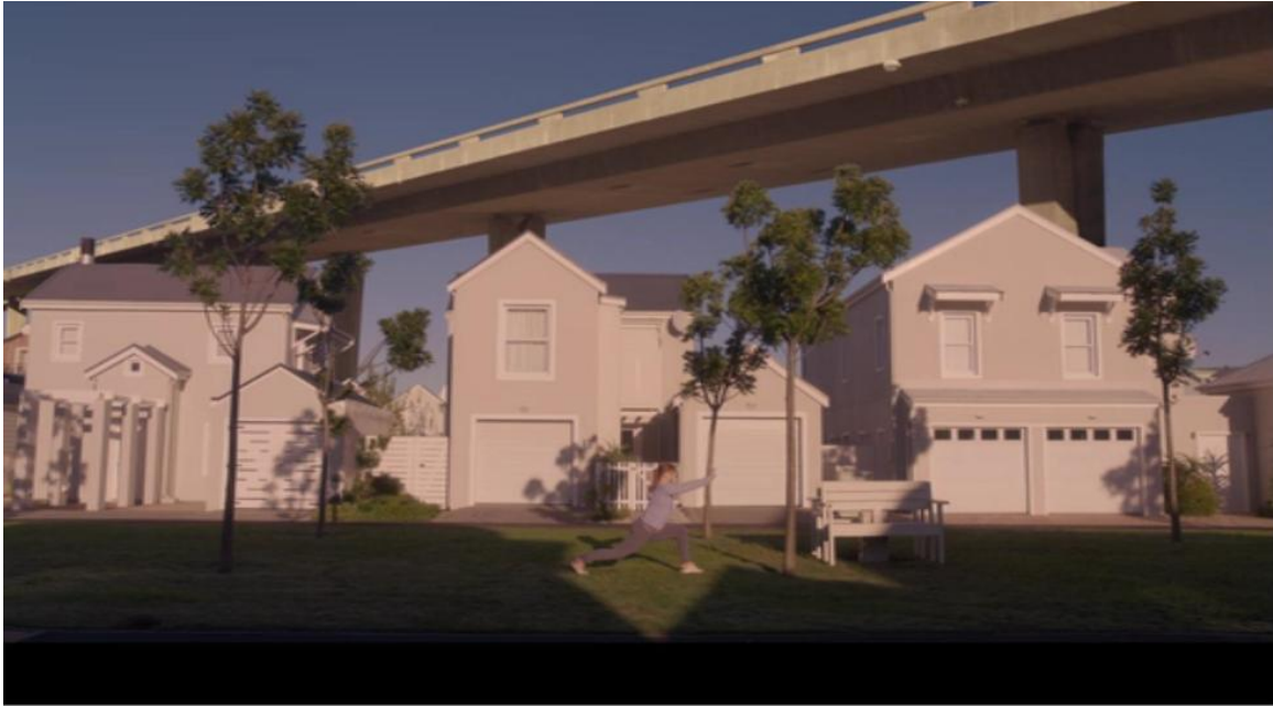
Figura 5 – Condomínio clean , em tom pastel, em “Nosedive”