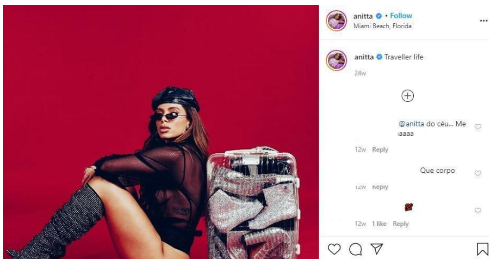
Figura. 1: Viagens e glamour no feed da cantora Anitta

ora em português (predominante), ora em inglês ou espanhol. A artista também divulga efusivamente as músicas (e seus respectivos videoclipes) “Contando Lunares” e “Rave de favela”, nos quais canta nas três línguas, contribuindo para “materializar” a ideia de uma artista constantemente em trânsito, seja ele linguístico, espacial ou sonoro. Mesmo em posts não relacionados a eventos específicos (fig. 1), a ideia de circulação frequente é enfatizada.