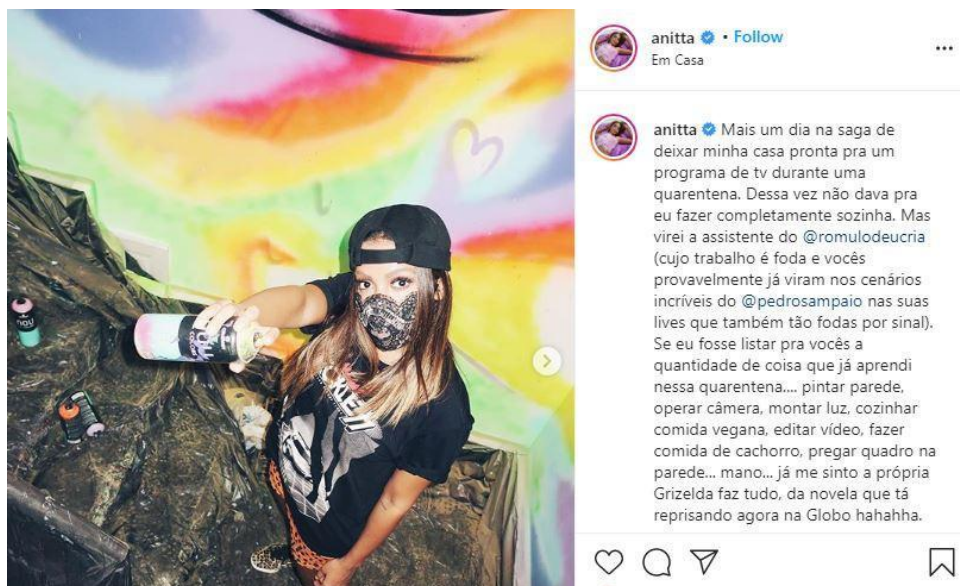
Figura 4: Anitta trabalha na reforma da sua casa antes de estreia em programa de tv

Anitta encerra o mês mostrando reformas (inclusive com a própria participação) em sua casa, que seria cenário do programa “Anitta dentro da casinha”, transmitido pelo canal a cabo Multishow (fig 4). “Se eu fosse listar pra vocês a quantidade de coisa que já aprendi nessa quarentena.... pintar parede, operar câmera, montar luz, cozinhar comida vegana, editar vídeo, fazer comida de cachorro, pregar quadro na parede”, escreveu no dia 29.