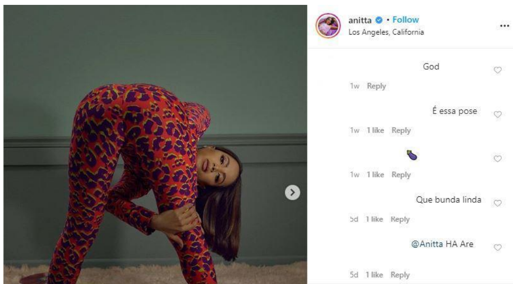
Figura 2: Ensaio postado por Anitta em fevereiro de 2020