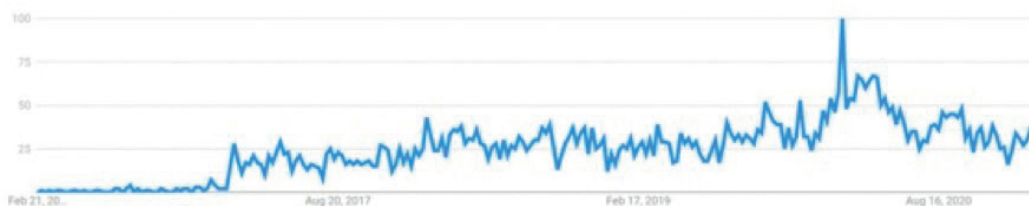
Figura 1: Gráfico das buscas por “ lofi hip hop ” no Google entre 2016 e 2021

As playlists têm um papel importante na difusão do gênero, em especial por uma particularidade que nos interessa observar: essas listas, em geral, têm indicações em seus títulos sugerindo que as músicas são para estudar, trabalhar, relaxar ou dormir. Parece contraditório que um mesmo tipo de música ajude o ouvinte tanto a ficar concentrado quanto a esfriar a cabeça. A questão é que o andamento, os encadeamentos harmônicos, a textura, todos os elementos sonoros são elaborados para que funcionem como música de fundo, para que não seja necessário prestar atenção nela, tampouco que ela nos distraia. Em 2020, o gênero atingiu seu recorde de buscas pelo termo na internet, justamente no primeiro ano da pandemia de Covid-19 (Figura 1). Diversos sites de notícias brasileiros fizeram matérias sobre o gênero e investigaram a relação entre o isolamento social e o sucesso do lofi hip hop (Moretti, 2020; Zaramela, 2020; Yamaguti, 2021).